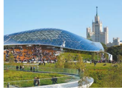
◀ Зал «Зарядье»