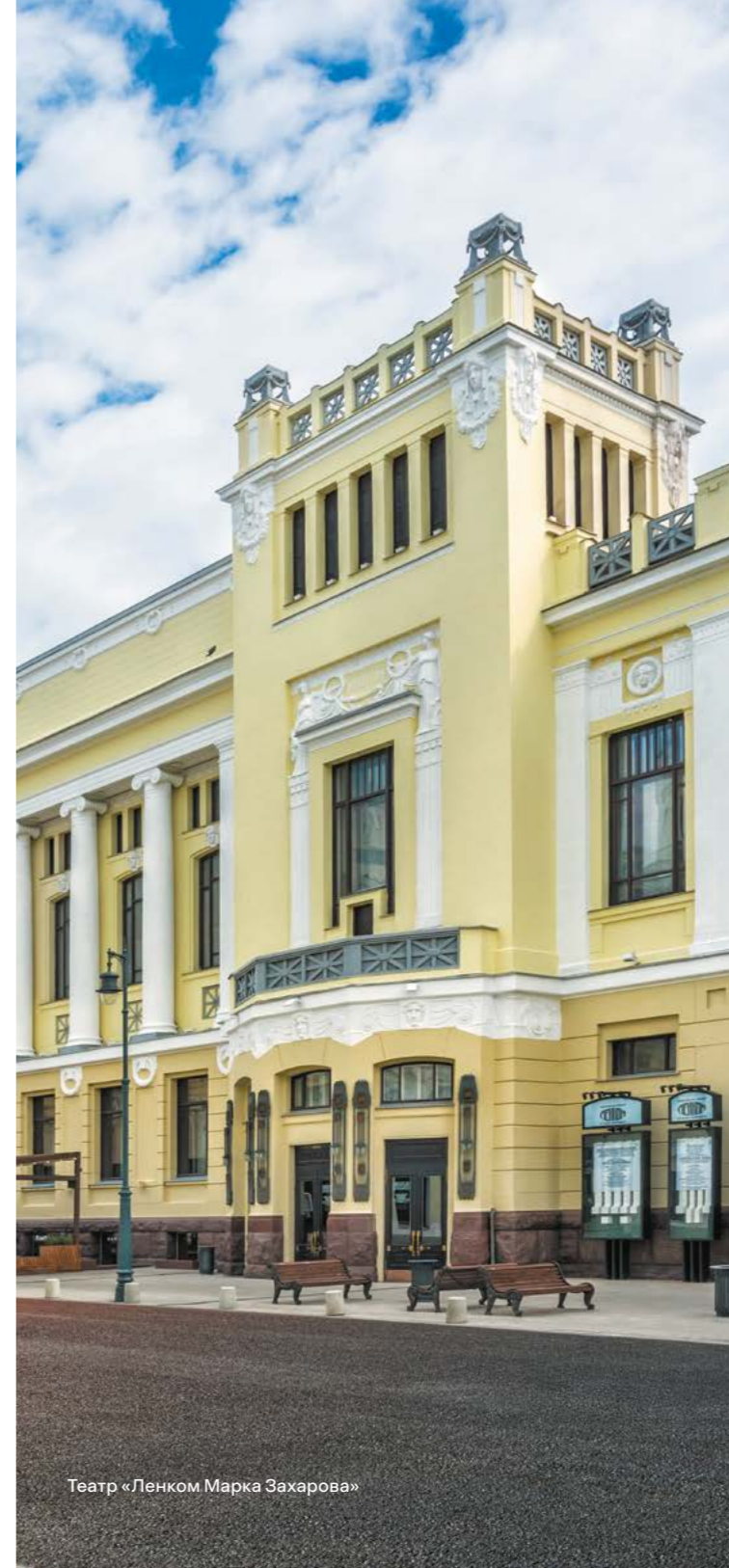
Театр «Ленком Марка Захарова»