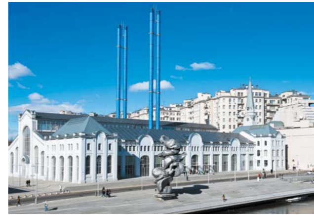
▲ Дом культуры «ГЭС-2»