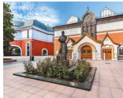
▲ Государственная Третьяковская галерея