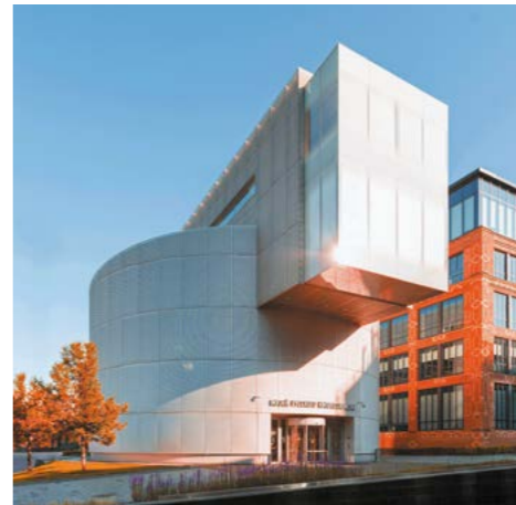
◀ Музей русского импрессионизма

Современный музей классического искусства на территории бывшей кондитерской фабрики «Большевик». Посетители могут познакомиться с искусством XIX–XX веков — в том числе с помощью тактильных макетов и ароматов по мотивам картин.