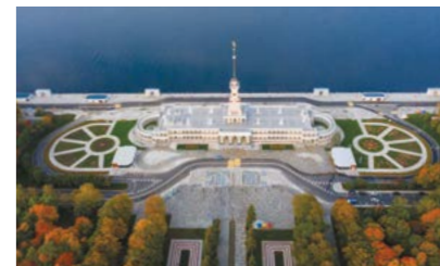
Парк Северного речного вокзала