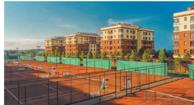
Русская теннисная академия во «Внуково Спорт Клуб»

ул. Сосновая, д. 62А, д. Анкудиново, р-н Внуково