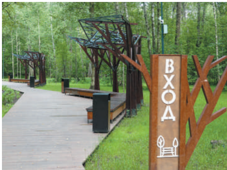
Парк «Филатов луг»