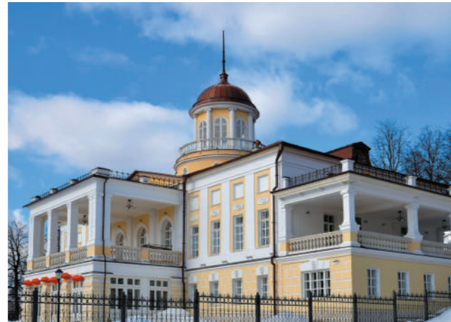
▲ Усадьба Старо-Никольское

А ещё Новая Москва — отличное место для времяпрепровождения, если у вас долгая пересадка в аэропорту Внуково. Здесь вы сможете отдохнуть после перелёта и интересно скоротать досуг до следующего рейса. Приезжайте в Новую Москву!