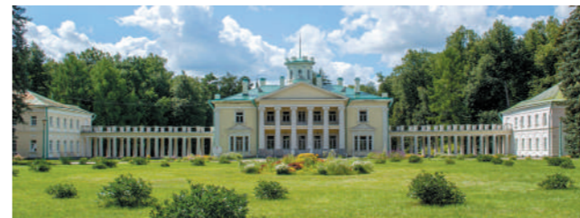
▼ Санаторий «Валуево»