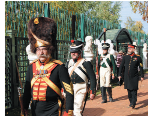
◀ Редут времён Отечественной войны 1812 года