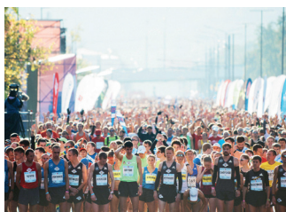
▲ 42.2公里的马拉松比赛

八月举行半程马拉松：这是一个家庭节日，有跑步、美食广场和音乐。通常的路线— 莫斯科河沿岸的一个圆圈 ( nightrun10km.runc.run )。