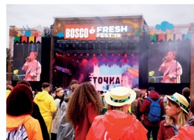
◀ Bosco Fresh Fest

Bosco Fresh Fest自2012年起在莫斯科举行。此前，冬宫花园和威登汉作为节日的主场，现在Fresh Fest已经掌握了麻雀山上的莫斯科先锋宫。明年它将出现在其他地方。最时尚和不可预知的青年节。