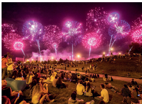
◀ “Rostec”国际烟火艺术联欢节

一，在整个夏天，您都有机会聆听军人音乐家们演奏的音乐，而军事音乐学校则以最高的演出质量而著称。应市民的要求，“斯帕斯卡亚塔”管理局恢复了最美丽的传统之一——公园和广场上的军事交响乐表演。