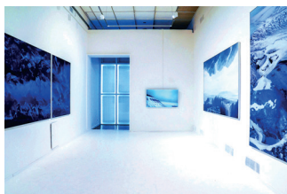
▼ 斯科当代艺术双年展

自2005年以来, 莫斯科当代艺术双年展( moscowbiennale.art )一直在坚持举办, 加强了该城市作为世界文化之都的地位。来自东欧和前苏联的特别有吸引力的艺术家