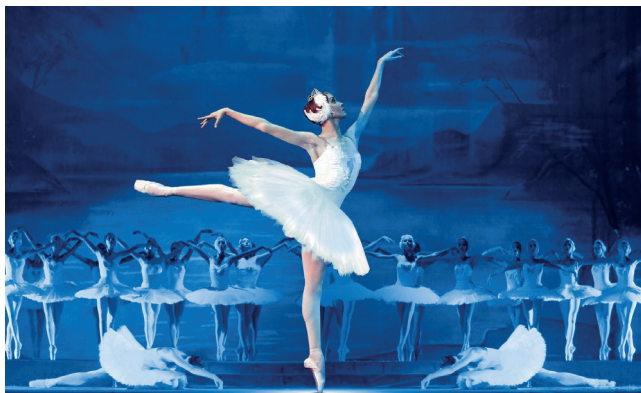
▲ 莫斯科国际电影节