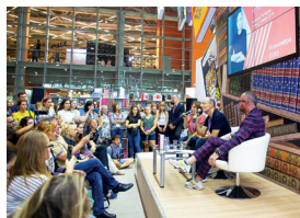
▲ 莫斯科国际图书博览会

莫斯科国际图书博览会是一个重要的国际论坛,是自苏联时期(第一次展览于1977年举办)于9月初举行的俄罗斯文士的第