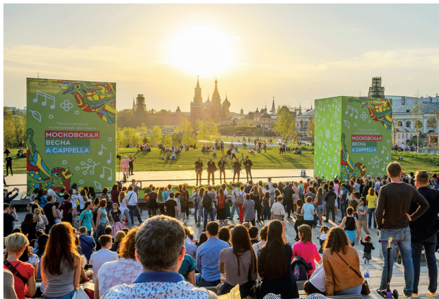
▼ 莫斯科春季A Capella

春天，莫斯科人和首都的客人都听到了传闻，因为在最意想不到的地方— 公园、房屋的阳台、食品商场，沿着莫斯科河巡航的机动船— 来自世界各地的参赛者举办现场音乐会。这是“莫斯科春季阿卡贝拉”(acappella.moscow)。由于这种形式假设表演者的乐器总是与其在一起，几乎任何城市空间都可以“突然”变成音乐会场地。