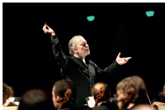
▲ 莫斯科复活节联欢

莫斯科“光圈”国际艺术节是一个童话故事，已被莫斯科人和首都的客人观看了好几年。2D和3D图形领域的照明设计师、化妆师和专业人士创造奇迹，而如此美丽的莫斯科在晚上变成了天堂一般的城市。