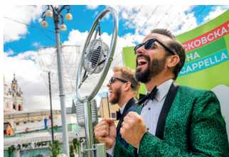
▲ 莫斯科春季 A Capella