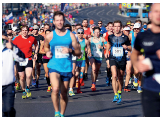
▲ 莫斯科半程马拉松比赛

八月举行半程马拉松：这是一个家庭节日，有跑步、美食广场和音乐。通常的路线— 莫斯科河沿岸的一个圆圈 ( nightrun10km.runc.run )。