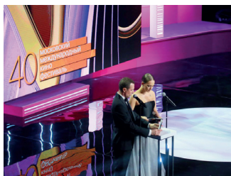
▲ 莫斯科国际电影节

在苏联，电影被认为是主要艺术。第一届国际电影节在莫斯科举行（此前只有威尼斯举办过类似的电影节）。评判组主席当时是谢尔盖·爱森斯坦本人。从1972年起，创立于1959年的莫斯科国际电影节再次获得国际电影制片人协会联合会（FIAPF）（ moscowfilm-festival.ru ）的A级认证，并且仍然是莫斯科国际电影节评委会成员，这对任何电影工作者来说都是一种荣誉。